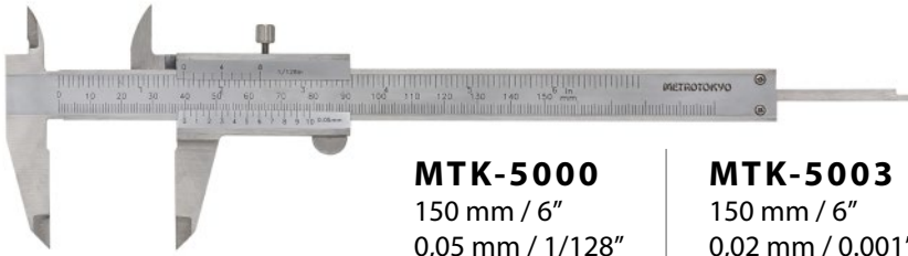
MTK-5000 150 mm / 6" 0,05 mm / 1/128"