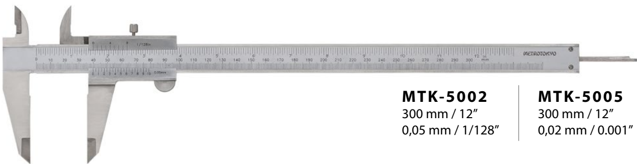
MTK-5002 300 mm / 12" 0,05 mm / 1/128"